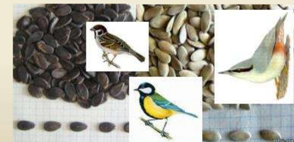
семечки арбуза и дыни